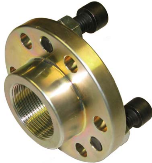
Punching socket 1086-6